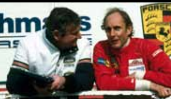
Damals wie heute ist der geniale Konstrukteur ein wichtiger Berater im Rennsport.