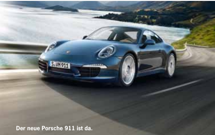
Der neue Porsche 911 ist da.