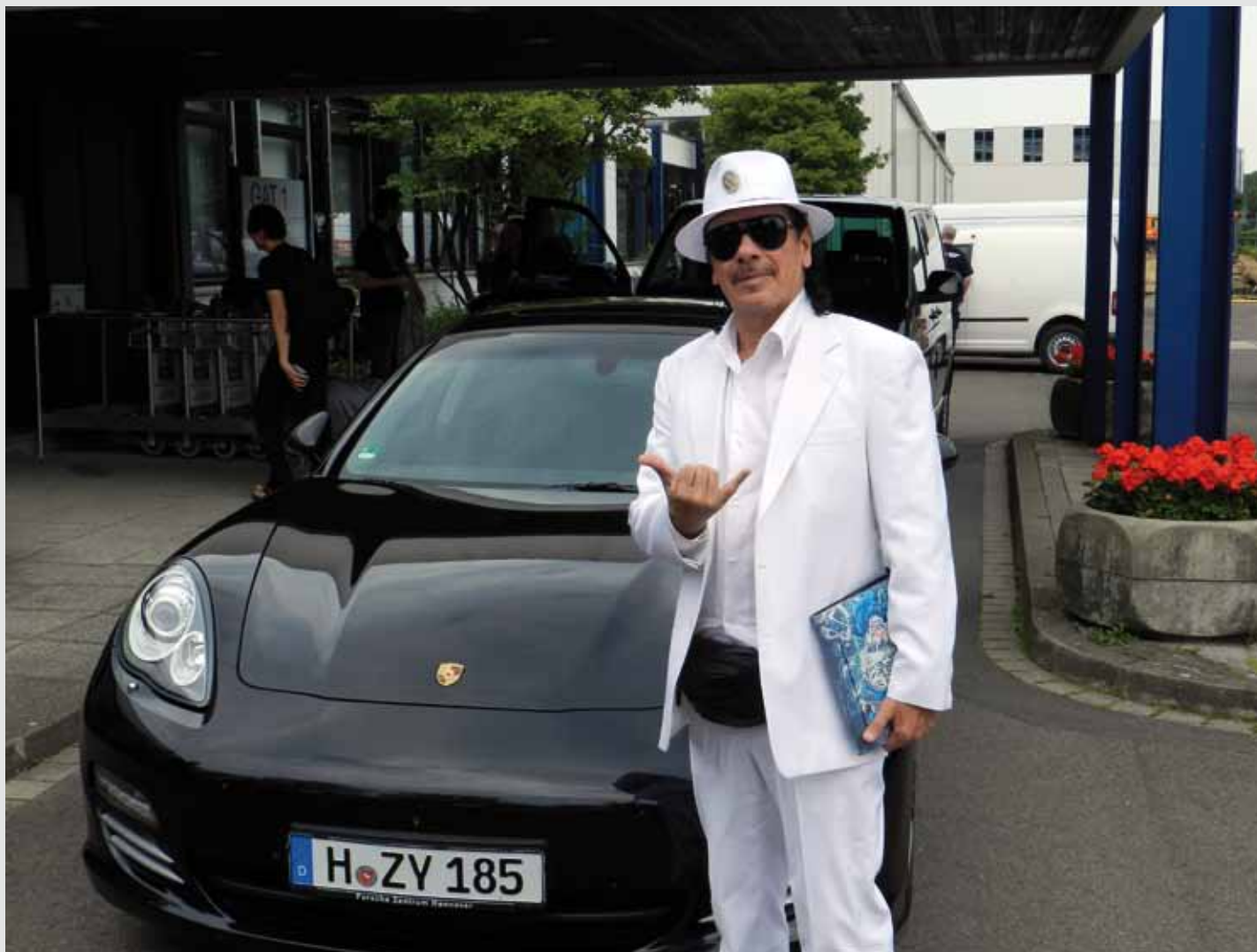
Carlos Santana mit einem Porsche Panamera 4S.

Carlos Santana hat am 28. Juni auf der Parkbühne in Hannover 3.000 Zuhörer in seinen Bann gezogen. Und ließ sich von der Faszination Porsche begeistern.