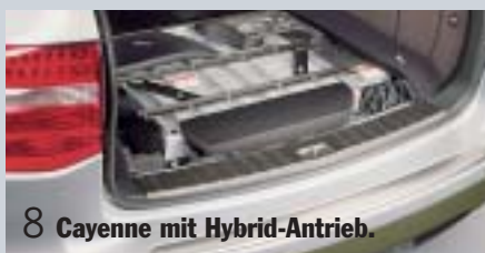
8 Cayenne mit Hybrid-Antrieb.